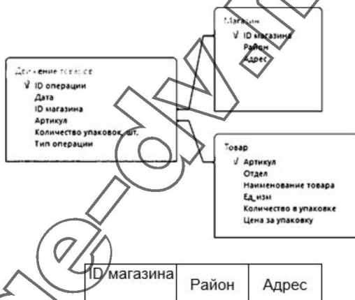
Таблица «Магазин» содержит информацию о местонахождении магазинов. Заголовок таблицы имеет следующий вид.

На рисунке приведена схема указанной базы данных.